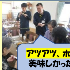
アツアツ、ホクホクで美味しかったです♪