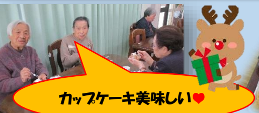
カフェケーキ美味しい♡